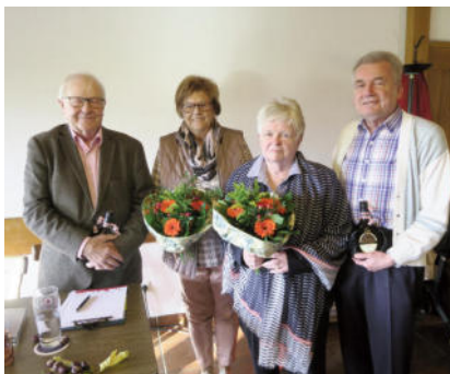
Verabschiedung des alten Vorstands